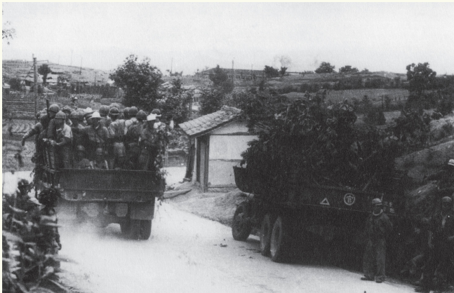
서울에서 철수해 수원지구로 집결 중인 국군 (임인식 소장)