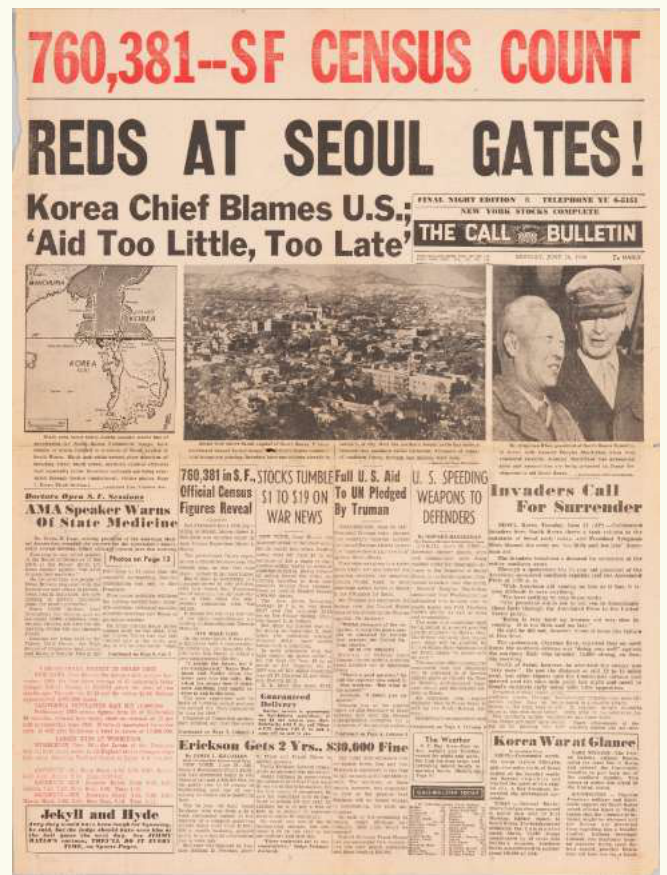
‘REDS AT SEOUL GATES!’라는 헤드라인으로 6·25전쟁 발발을 알리는 1950년 6월 26일자 SAN FRANCISCO THE CALL BULLETIN (국립민속박물관 소장)

서울이 무너지자 모든 시선은 수원으로 향했다. 한강선 방어를 지휘할 시흥지구전투사령부가 급히 편성되었지만 정작 병력이 없었다. 한강을 건너온 패잔병들을 삼삼오오 재편성해 간신히 방어선을 구축한 것이 6월 29일이었다.