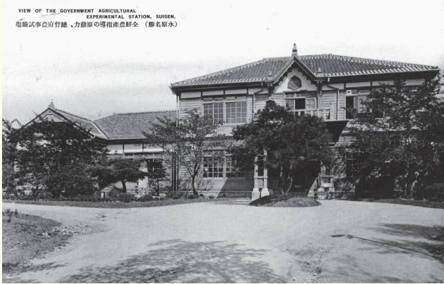
극동군사령부 전방지휘소로 사용되었던 중앙농업기술원

군사령부 전방지휘소를 설치했다. 다음 날에는 서울에서 철수한 육군본부와 주한미군사고문단까지 합류하면서, 일본식 건물 몇 채가 한·미 양군의 임시 지휘 본부로 탈바꿈했다.