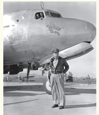
1950년 6월 29일 수원비행장에 도착한 이승만 대통령과 처치 준장(왼쪽), 맥아더 총사령관(오른쪽)