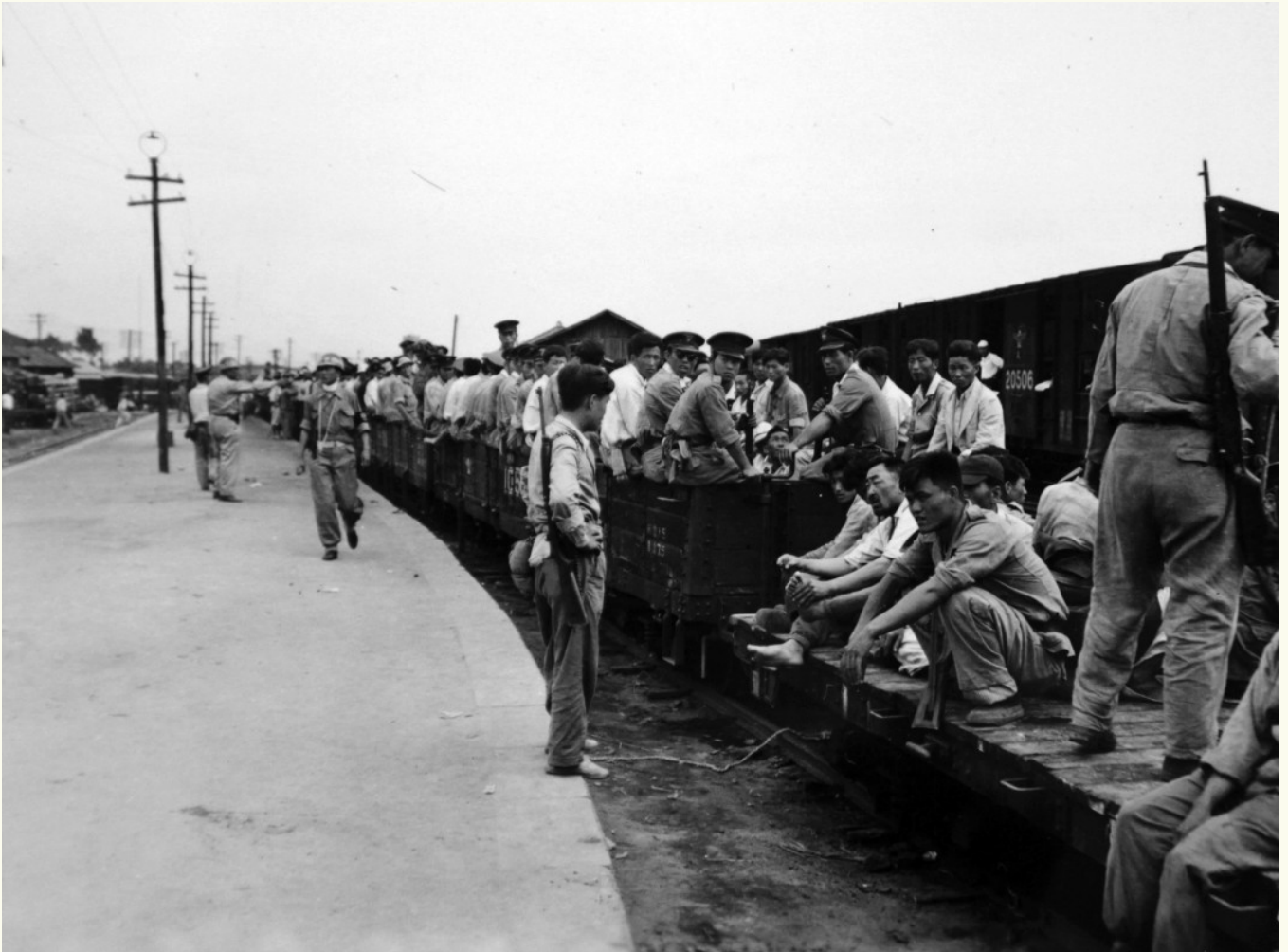
1950년 7월 1일 무개화차에 탑승한 군인과 경찰들. 사진 뒷면에는 '전방으로 향하는 국군'이라고 적혀 있다.

그의 한마디로 폭파 명령은 거두어졌다. 하지만 장안문은 9월 26일 오전 11시 미군기의 폭격으로 반파되는 비운을 맞게 된다.